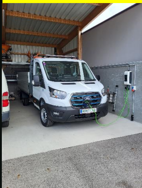
Wir setzen Taten