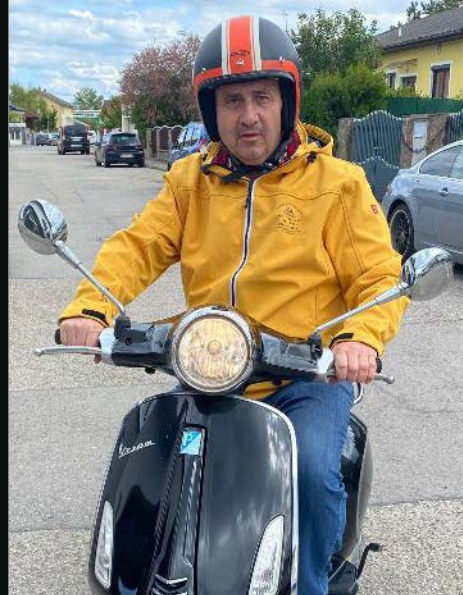
Viele setzen Zeichen

Und: Selbstverständlich versorgen wir das Fahrzeug mit selbst produziertem Strom.