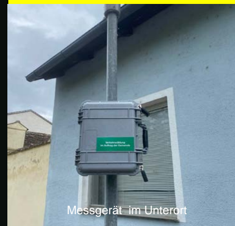
Messgerät im Unterort

Andere sagen: „Man müsste mal!“ Wir machen mal!