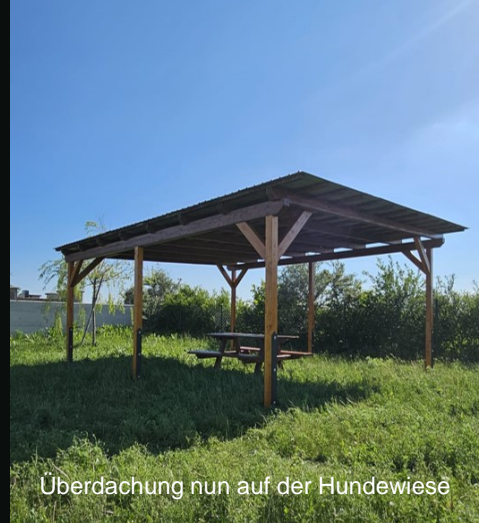
Überdachung nun auf der Hundewiese

Am ehemaligen Standort der Firma Kuhn wird die Firma Rosenbauer einziehen und einen Servicestandort für Feuerwehrfahrzeuge für die Region Ost-Österreich einrichten. Die Renovierungsarbeiten starten in den nächsten Tagen, die Betriebsaufnahme ist dann im Herbst vorgesehen. In der Startphase sind 14 neue Arbeitsplätze in Achau zu erwarten, im Endausbau sollen es bis zu 30 an der Zahl werden.